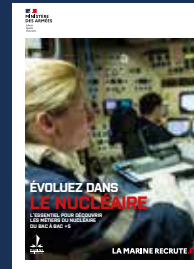
LE GUIDE NUCLÉAIRE