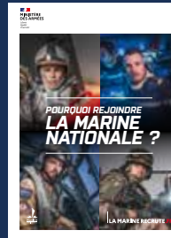
LE GUIDE GÉNÉRIQUE